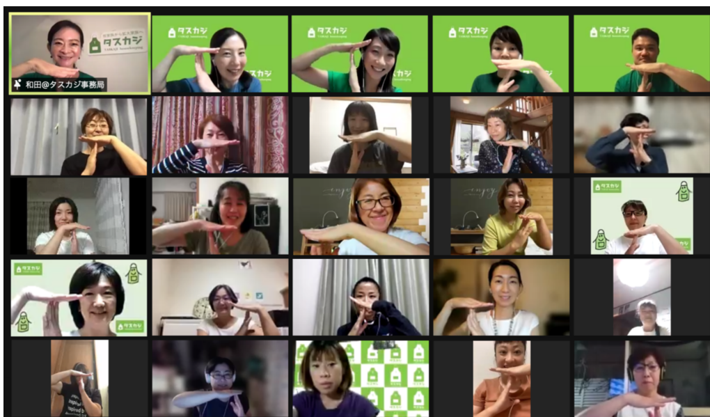
タスカジさんフェス 2021 の様子

（*1）2020年12月タスカジ研究所「ジェンダー平等、働きがいにおけるSDGs(5)と(8)の実態調査」 https://corp.taskaji.jp/information/release/2020/12/25/sdgs-survey0001/